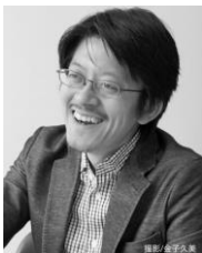
日本初の「かたづけ士」 『かたづけを通して人生を変えるコンサルティング』 スッキリ・ラボ 代表