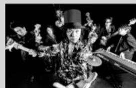
二人目のジャイナ