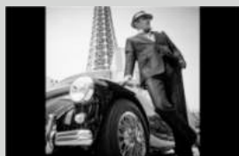
クレイジーケンバンド