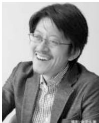
日本初の「かたづけ士」 『かたづけを通じて人生を変えるコンサルティング』 スッキリ・ラボ 代表