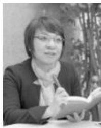
事務員が辞めても慌てない仕組みづくりの専門家 事務改善アドバイザー OFFICEキスク 代表